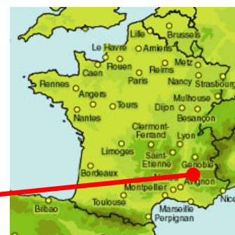
Station d'épuration de CASA

L'implantation retenue tient compte des nombreuses contraintes liées au site dédié (voie SNCF, usine ARKEMA, pilonnes RTE, Canal de Manosque).