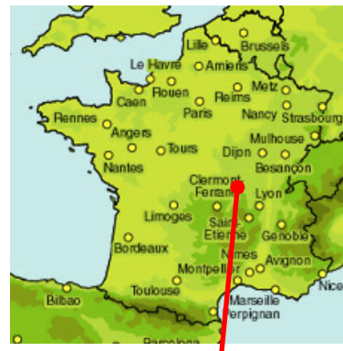
STEP de DIGOIN