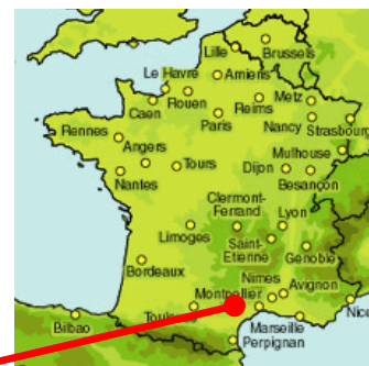
Station d'épuration de Fontes

Ainsi, notre prestation prévoit le renouvellement de plusieurs équipements (dégrillage, rampes, surpresseurs...) et de compléter le traitement des boues par géotubes.