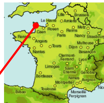
Usine de Chef-du-Pont

Dans le cadre de la sécurisation de sa ressource en eau potable dédiée à son process de fabrication de desserts lactés, la société Mont Blanc a lancé un projet de construction d'une installation de traitement des paramètres Fer et Arsenic présents en excès dans les forages F2 et F3 exploités sur le site.