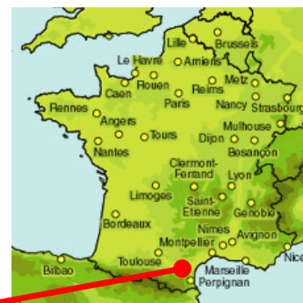
Station d'épuration de Pouzols Minervoises et Sainte Valière

Le GRAND NARBONNE a décidé de remplacer les ouvrages d'épuration actuels des stations de Pouzols Minervoises et de Sainte Valière en construisant une nouvelle station intercommunale. La nouvelle filière a été conçue dans le but de respecter les nouvelles normes de rejet imposées. L'ensemble des postes a été conçu de manière à faciliter l'exploitabilité de la nouvelle station.