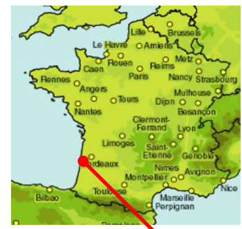
Stations d'épuration du SIBA