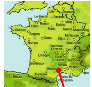
Réservoir d'eau potable de St Saturnin de Lucian

Ainsi, les travaux prévoient la construction d'un nouveau réservoir de capacité 1.200 m 3 à proximité du réservoir existant et l'installation de nouveaux équipements de robinetterie ainsi que d'une nouvelle installation de désinfection au chlore gazeux.