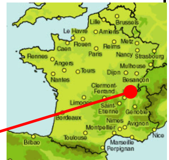
Station d'épuration d'Oyonnax

L'opération comprend également la construction de deux bassins d'orage.