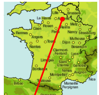
STEP de RONSSOY

Dans le cadre de ce projet, nous avons attaché une attention particulière sur la simplicité d'exploitation et sur l'aisance d'ergonomie par la création d'une large voirie circulaire et l'installation des ouvrages au plus proche de celle-ci.