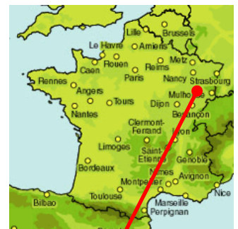
STEP de MELISEY