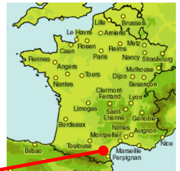
Station d'épuration de Pouzols Minervoises et Sainte Valière

Le GRAND NARBONNE a décidé de remplacer les ouvrages d'épuration actuels des stations de Pouzols Minervoises et de Sainte Valière en construisant une nouvelle station intercommunale. La nouvelle filière a été conçue dans le but de respecter les nouvelles normes de rejet imposées. L'ensemble des postes a été conçu de manière à faciliter l'exploitabilité de la nouvelle station.