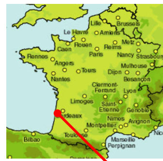
Commune de LANTON