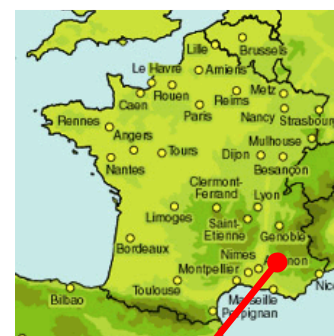
Station d'épuration de Sisteron

La station d'épuration reçoit les effluents de la ZAC Val de Durance composés à 80% d'eaux usées issues des abattoirs ovins et nécessite une rénovation afin de respecter les rejets réglementaires c'est pourquoi la Collectivité engage plusieurs travaux sur les files Eau et Boues.